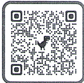
QR Code สมัครออนไลน์

จึงเรียนมาเพื่อโปรดพิจารณาให้บุคลากรในสังกัดเข้ารับการอบรมฯ และเผยแพร่ข้อมูลดังกล่าวให้ทราบทั่วกันด้วย จะเป็นพระคุณยิ่ง