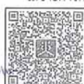
เอกสารสิ่งที่ส่งมาด้วย ๒