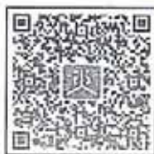
เอกสารสิ่งที่ส่งมาด้วย ๑